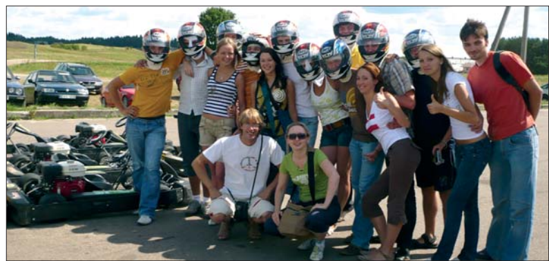
Šiemet vingiečiai išgyveno iki tol nepatirtus išpūdžius – pasivažinėjimą Aukštadvario kartodrome.

turite virdulį? O vandens?“. Vakare visi rinkosi prie laužo aptarti savaitės planus ir iškelti Aukštadvario stovyklos ir Lietuvos vėliavas.