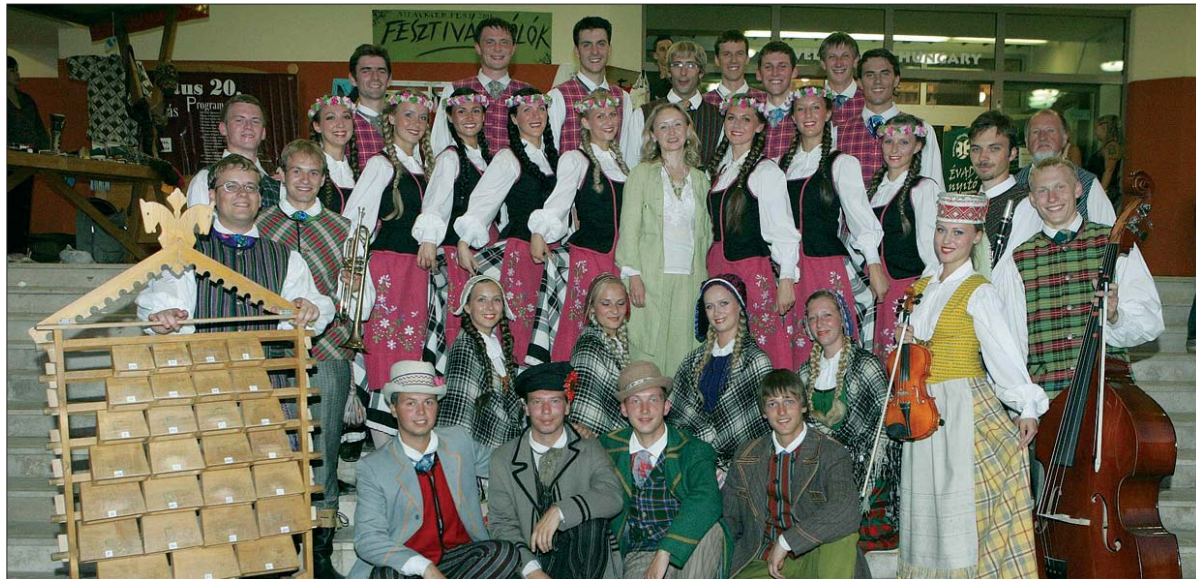
Šiemet ansamblis buvo pakviestas į XV jubiliejinį tarptautinį „Summerfest“ festivalį Vengrijoje.

Savaitgalis Aukštadvario stovykloje prasidėjo senųjų vingiečių, dar va-