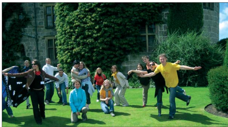
Velso Chirk pilies soduose: už apsilankymą pilyje buvome paprašyti susimokėti dainomis.

Diena, turtinga įspūdžių ir nepaprasta, o dar laukė atsiveikimas su mus globojusiomis šeimomis.