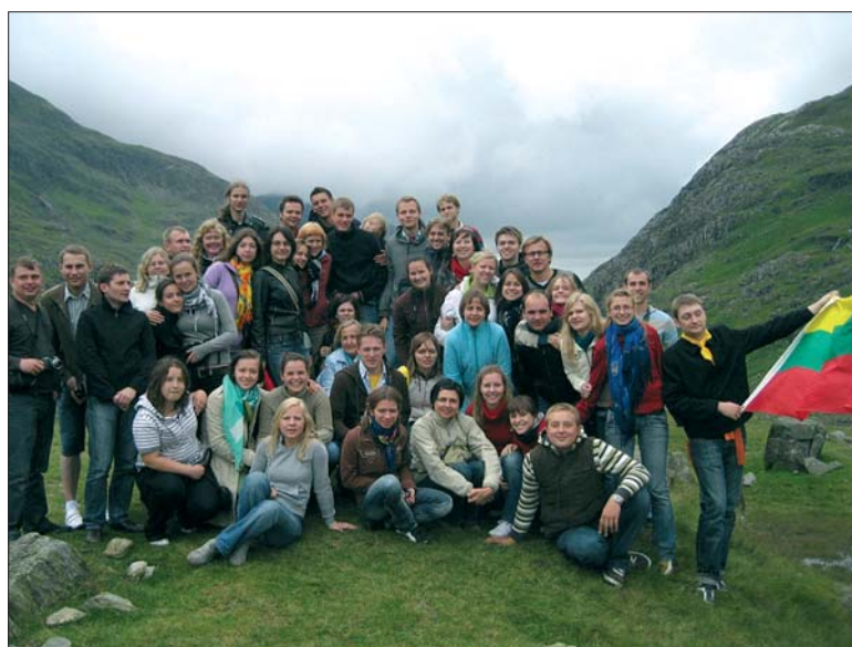
Vels-Snowdonia – aukščiausia vieta Velse.

Liepos 11 d. – „Didžioji diena“. Buvo leista miegoti iki pietų, tik mie-